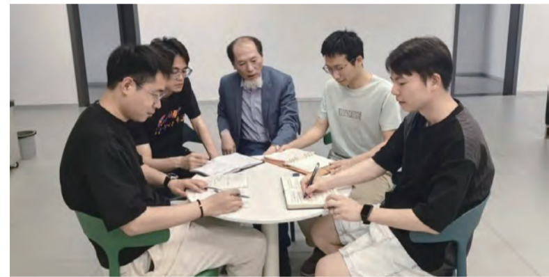
技术骨干讨论项目中的难题

经过120多个日日夜夜的艰苦奋斗，快堆调试技术支持青年突击队用专业的态度，解决了调试出现的种种问题，保证了任务的顺利推进。大家纷纷表示：“这个‘夜猫子’，我们没白当！”