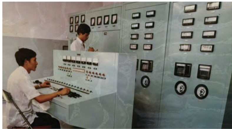
自主研发的高温高压阀门试验装置

1965年4月，我刚完成整理资料的任务，就接到上级通知让我们走，军队来接我们，从兰州出发。当时的我们根本不知道目的地是哪里，整个行程中车队不停靠大站，只在一些小站或者压根没站点的地方歇脚。1965年4月30日，我们到了成都，之后又继续开往宜宾，第二套生产基地定在了宜宾。到了宜宾以后，就借了宜宾农校的教室、大礼堂，工作了大概不到一年，后期因多种原因又把厂第二套生产基地迁到了四川乐山市金口河，即八四一厂。我们设计院落脚到峨眉山伏虎寺，在伏虎寺里建立一个临时点，既是宿舍也是办公场