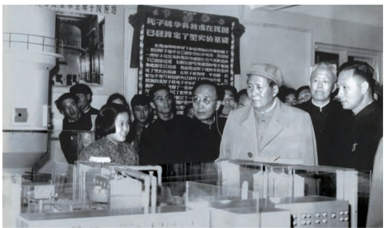
1958年,毛泽东主席参观我国第一座实验性重水反应堆模型

深谋远虑的毛泽东主席,从保卫祖国安全、维护世界和平的战略高度,以伟大政治家的豪迈气魄庄重指出:“我们不但要有更多的中子和质子,还要有原子弹。在今天的世界上,我们要不要人家欺负,就不能没有这个东西!”